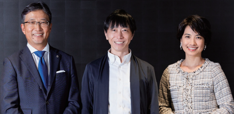
ブルデンシャル生命保険株式会社 執行役員 エグゼクティブ・ライフプランナー